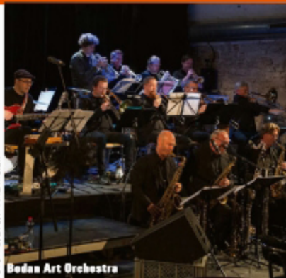
Bodan Art Orchestra

Das Bodan Art Orchestra unter der Leitung des bekannten Posaunisten und Bandleaders Gilbert Tinner steht für qualitativ hochstehende, zeitgenössische Musik und besticht durch ungeheure Energie, grosse Kreativität, Spielfreude, Humor sowie eine gehörige Portion Unberechenbarkeit. Unter dem Motto "The Four Seasons" wird sich das Bodan Art Orchestra auf der Tournee 2023 ausgiebig mit den vier Jahreszeiten befassen. Ob von Heuschneppen geplagte Frühlingsmüdigkeit, stürmische Sommergewitter, melancholisch anmutende Herbstnebelchwaden oder frostige Winternächte, die Komponisten des Bodan Art Orchestra werden ihre Impressionen einmal mehr in spannenden und facettenreichen Werken präsentieren. Als Gast